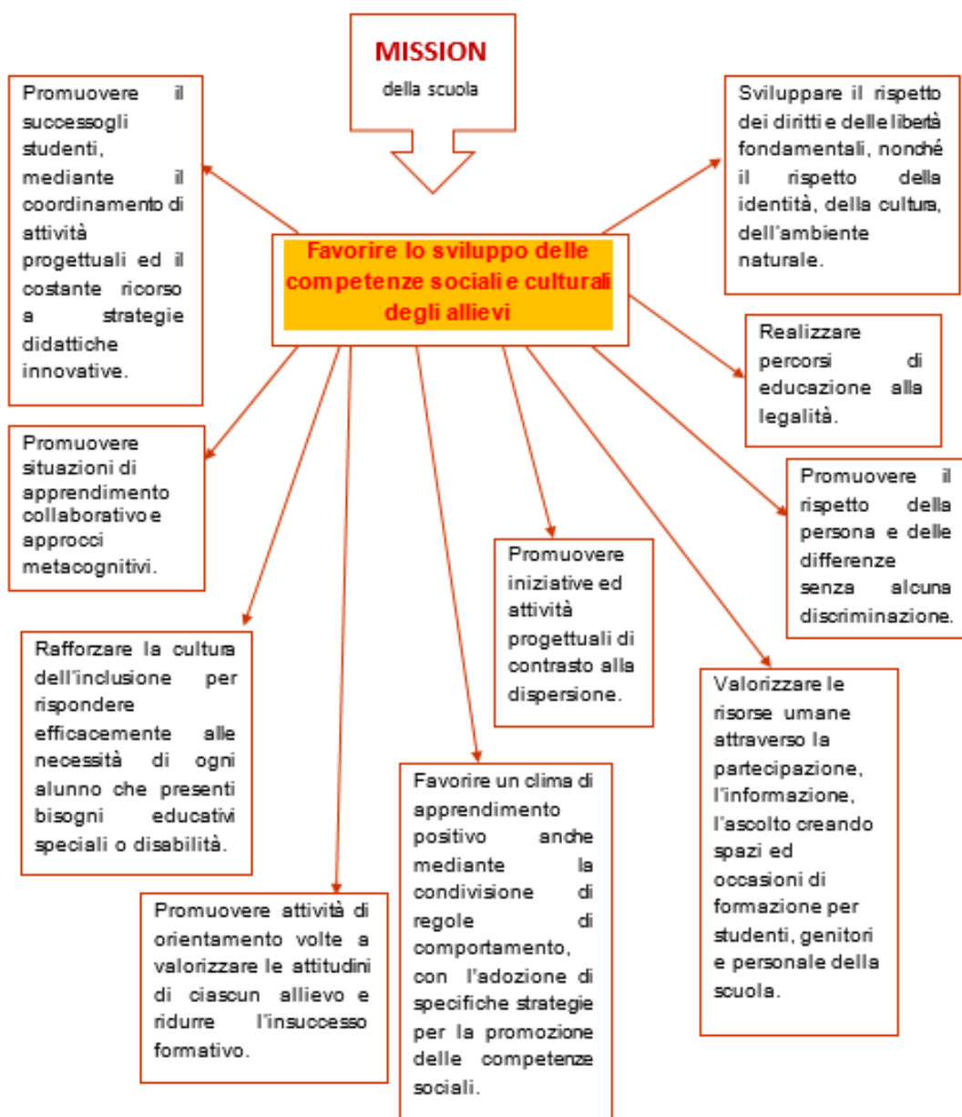
Figura : Mission della scuola