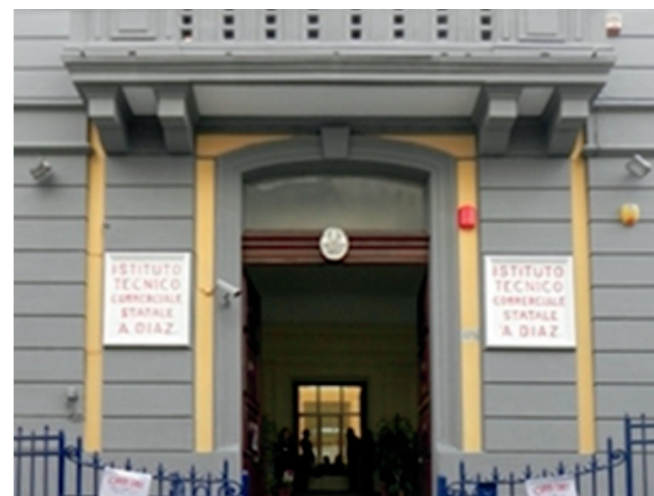
Sede "Armando Diaz"