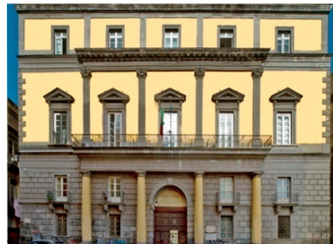
Sede "Elena di Savoia"